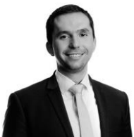
Autori: Mgr. Ján Macej, PhD., advokát Eversheds Sutherland, advokátska kancelária, s.r.o.

V súvislosti s platobnou neschopnosťou Zákon opätovne zavádza povinnosť dlžníka , ktorý je právnickou osobou, podat' na seba návrh na vyhlásenie konkurzu . Podľa súčasnej úpravy má dlžník túto povinnosť len v prípade predĺženia, nie však v prípade platobnej neschopnosti. Nové vymedzenie platobnej neschopnosti a s tým súvisiace práva a povinnosti budú účinné od 17. 7. 2022.